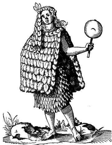
Ilustraciones: grabados europeos siglo XVI