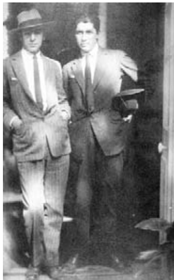
Pablo Neruda junto a Tomás Lago

Nº INVENTARIO: 3178 Máscara zoomorfa miniatura. Carnaval de Oruro – Bolivia. Colección MAPA. Yeso policromado. Medidas: 7,7 x 8,7 x 5cm